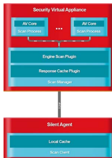
Figure 3: Aperçu de l'architecture d'analyse

Security for Virtualized Environments de Bitdefender utilise un mécanisme de mise en cache intelligent unique, dont le brevet est en cours d'homologation, qui crée une liste blanche d'applications et de fichiers courants du système d'exploitation. Ce processus améliore de façon significative les performances d'analyse des machines virtuelles, et est mis à jour en continu. Cela est possible grâce aux deux niveaux de cache utilisés par la solution. L'un d'entre eux est un cache d'auto-apprentissage, intégré à la SVA. Silent Agent utilise un cache local pré-rempli en fonction des variables de son environnement. Il peut donc transférer l'analyse des objets requis uniquement, tout en excluant les objets qui sont répertoriés comme étant sûrs.